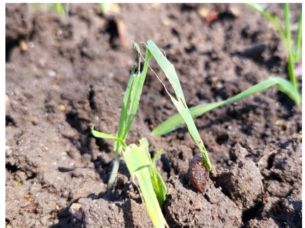
Snegleangreb i vårbygmark med udlæg

Der findes flere midler til anvendelse mod snegle, f.eks. SluXX HP der skal anvendes i en dosering på 7 kg pr. ha pr. kørsel.