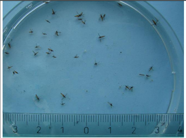
Masser af små galmyg, ca. 2mm store, fra fangbakke placeret i en 2. års engrapgræs. Ikke alle typer galmyg skader engrapgræs.