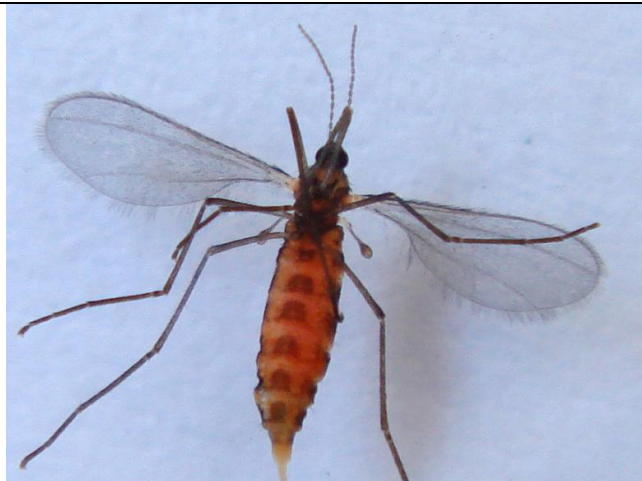
Den rigtige engrapgræsgalmyg er behåret på vingerne og er lidt større end svampemyggen.