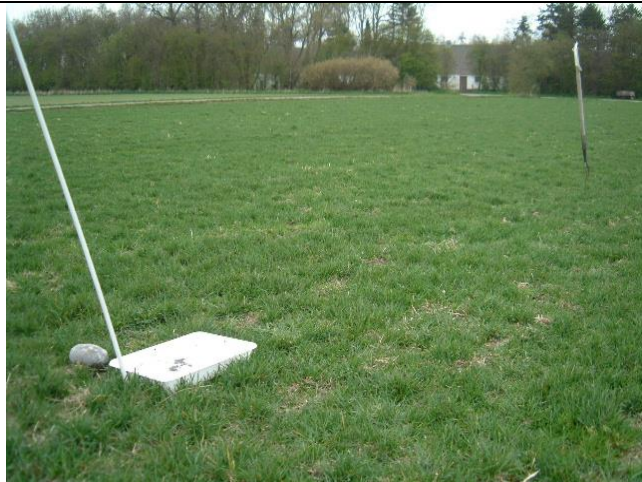
Plastbakke med vand + en dråbe sulfo, udsat i engrapgræsmark.