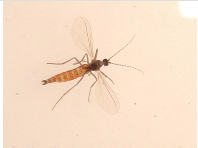
Svampemyggen – laver ikke skader i engrapgræs.