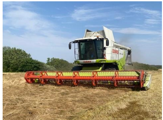
Høst af alm. rajgræs Double i uge 29 - Fyn

Husk at rajgræs skal høstes når vandprocenten er mellem 20 og 25%. Her er det muligt at lave en god råvare, og de fleste avlere kan også styre det på tørreriet med den vandprocent.