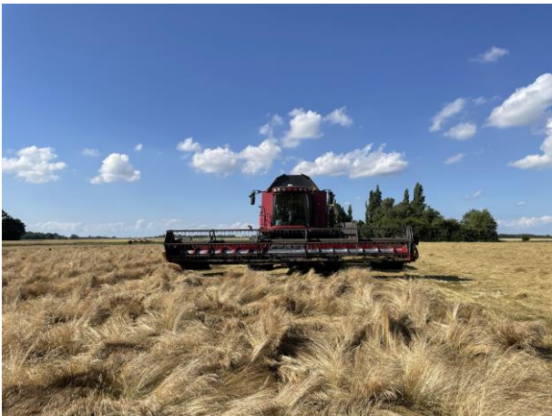
Høst af rødsvingel Hastings i uge 28 - Lolland

Rødsvingel udgør 27% af vores areal. Høsten er foregået i uge 27 og 28 og er overstået. Høsten er gået nemt, og vi forventer udbytter godt over middel i denne art. Rumvægten ser ud til at være bedre i år end sidste år og meget bedre end forrige år, hvor vi havde store problemer med vægten.