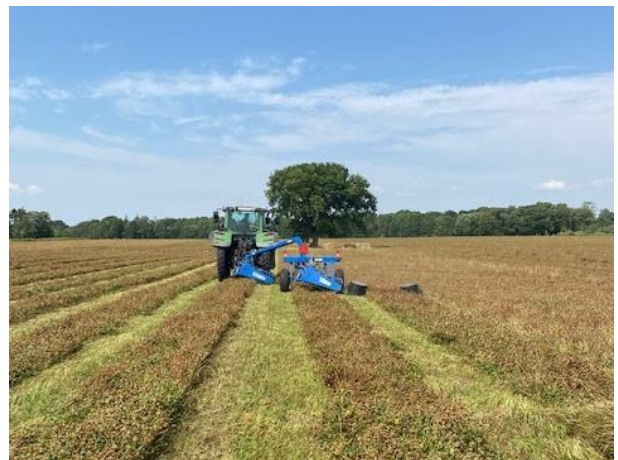
Skårlægning af hvidkløver i uge 29 - Fyn

Hvidkløver udgør 4% af høstarealet. De fleste kløvermarker er skårlagt i uge 28 og 29 og mange har høstet i sidste uge og i weekenden. Der er vel høstet halvdelen af arealet og udbytterne for den konventionelle avl ser lovende ud. Sidste år havde vi store problemer med skadedyr og specielt i de økologiske marker. Umiddelbart er dette problem mindre i år, men vi må se når vi får udbyttetotal for de økologiske marker.