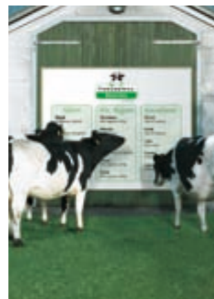
Датские коровы выбирают Фестулолиум

Опыты 2008 года с Фестулолиумом в Датской сельскохозяйственной консультационной службе снова показали, что сорта DLF-TRIFOLIUM дают отличные результаты. Сорта фестулолиума (сортотип райграса) Ахиллес и Персеус дали 15% и 20% прибавки урожая во второй и третий годы использования соответственно в сравнении с райграсом пастбищным. Качество корма также было отличным.